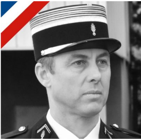
Frère, Lieutenant-Colonel Arnaud Beltrame 1973 – 24/03/2018

C'est dans ce contexte que la mémoire de deux personnages me vient à l'esprit en plus de tous ceux dont la vie leur fût enlevée par des fanatiques robotisé par des égrégores par trop humains. L'un et l'autre est archétype de mes propos : Notre frère, le Lieutenant-Colonel Arnaud Beltrame et le Professeur Samuel Paty.