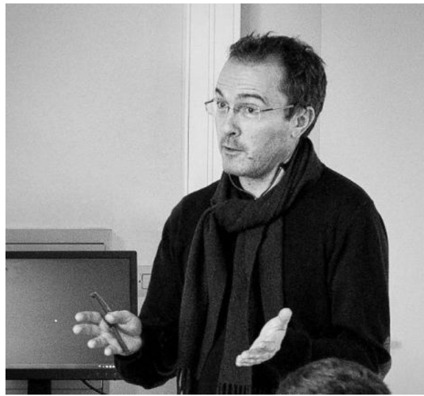
Professeur Samuel Paty 1973 – 16/10/2020